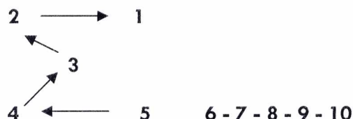
Figura n. 2

La squadra che commette fallo di rotazione perde il quindici.